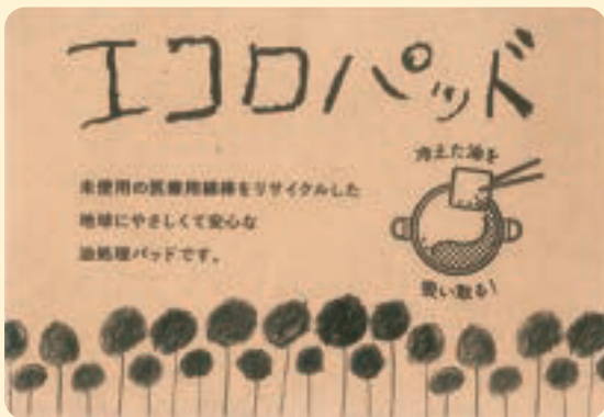
●利用者が描いた新ラベル

当園では企業とコラボしている商品があります。「エコロパッド」は平和メディック様から規格外の綿棒を提供していただき、綿部分を再利用して油処理パッドとして製造しています。作業工程は大変シンプルであるため、多くの利用者が作業に携わっています。