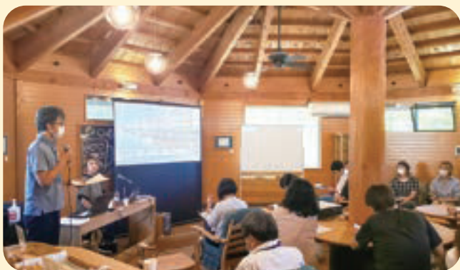
“かっこの森”で行われた講演会

当園は令和6年1月から、生活介護と共に就労継続支援（B型）を新たに開始する予定です。企業との協業や地域との交流の場となる「かっこの森」、新たに開設するアンテナショップ等を積極的に活用し、地域との関わりを深めていきます。