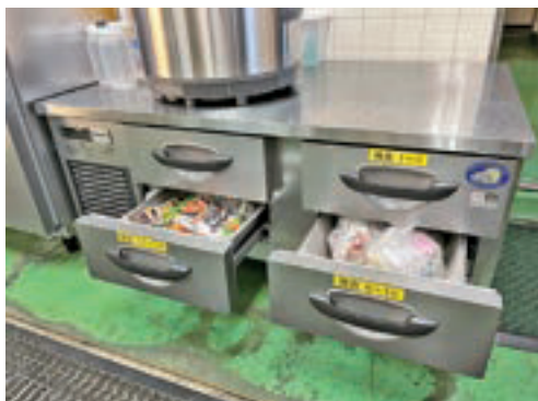
厨房ドローワー冷凍庫（夕陽ヶ丘）

《厨房ドローワー冷凍庫更新事業》 （篠原欣子記念財団助成金） 総事業費 421,500円 （内、助成額 360,000円） 引き出し型冷凍庫の更新により、大量調理施設衛生管理マニュアルに即した保存食の保管が実施でき、万が一食中毒事故及びその疑いの発生時、発生原因の調査が可能となっております。